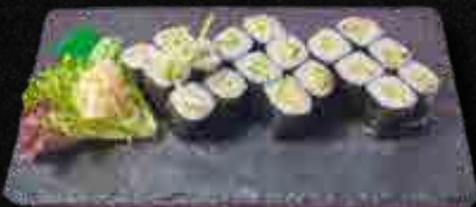
MENÜ 5 f,11 10,90

1 Maguro, 1 Sake, 1 Tamago, 1 Ebi, 6 California Maki, 4 Lachs I.O