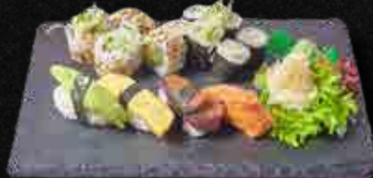
MENÜ 6 a,f,11 13,90

6 Avocado Maki, 6 Oshinko Maki, 6 Kappa Maki