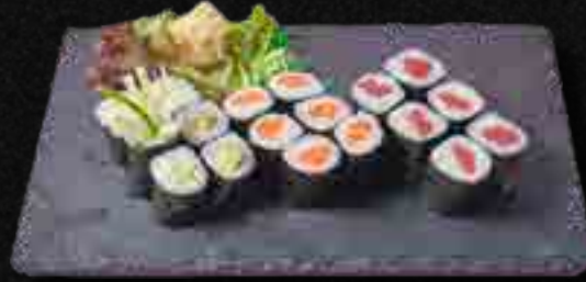
MENÜ 2 b,f 11,90

2 Sake Nigiri, 6 Sake Maki, 6 California Maki