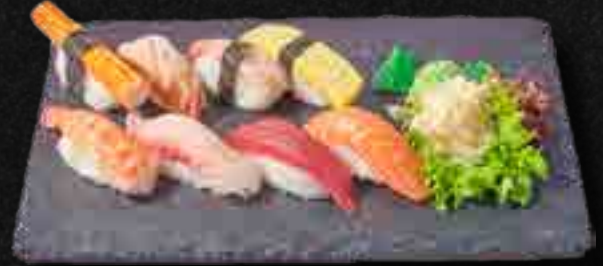
MENÜ 10 a,b,c,d,f,m 15,90 1 Maguro, 1 Sake, 1 Izumidai, 1 Ebi, 1 Tamago, 1 Unagi, 1 Kani, 1 Amaebi