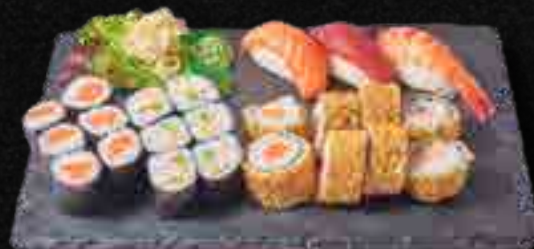
MENÜ 8 b,c,d,f,4 18,90

1 Maguro, 1 Sake, 1 Tamago, 1 Ebi Nigiri, 6 Sake Maki, 8 California I.O