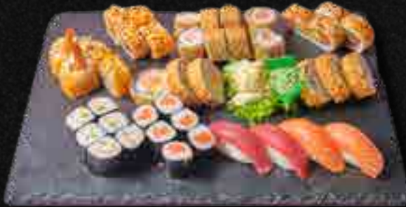
MENÜ 11 LONG FOR TWO a,b,c,d,f,m,i,4 36,90 4 Nigiri (Sake, Maguro), 8 Sake Avocado I.O., 1 Maki Lachs, 1 Maki California, 6 Shark Special Lachs, 4 Tempura Ebi Special, 8 Mini Baked Rolls Lachs