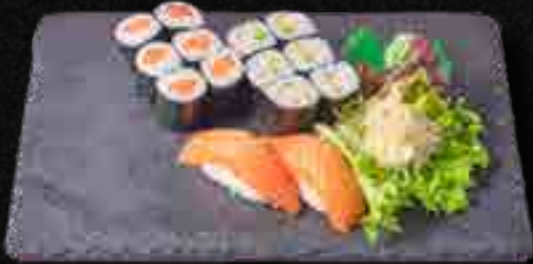
MENÜ 1 b,c,n 11,90

2 Sake Nigiri, 6 Sake Maki, 6 California Maki