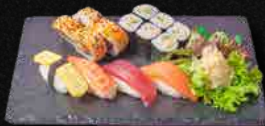
MENÜ 4 a,b,c,d,f 14,90

1 Sake, 1 Izumidai, 1 Amaebi Nigiri, 6 Sake Maki, 4 California I.O