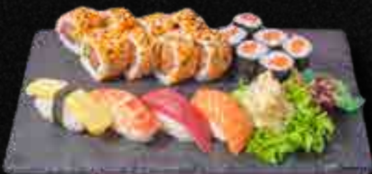
MENÜ 7 a,b,c,d,f,4 17,90

1 Tamago, 1 Inari, 1 Shiitake, 1 Avocado, 6 Kappa Maki, 4 Vegetarische I.O