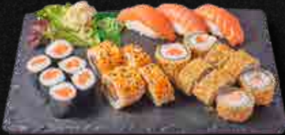
MENÜ 9 a,b,c,d,f,m 18,90 6 Sake Maki, 4 Sake I.O., 8 Mini Baked Rolls, 3 Sake Nigiri

alle Menüs werden mit Miso Suppe serviert (nur zum Verzehr vor Ort) Menü 11, Menü 22 werden mit 2 Miso Suppe serviert Menü 12 werden mit 4 Miso Suppe serviert