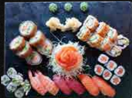
MENÜ 22 LONG FOR TWO b,c,d,f,m 37,90 6 Nigiri (Sake, Maguro, Ebi), 12 Maki (Sake & Kappa), 8 California I.O., 6 Shark Special Lachs, 6 Sashimi