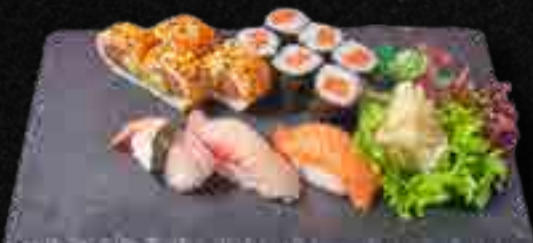
MENÜ 3 b,c,d,f 13,90

6 Sake Maki, 6 Tuna Maki, 3 Kappa Maki, 3 Avocado Maki