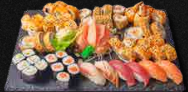
MENÜ 12 LONGEST SUSHI a,b,c,d,f,m,i,4 69,00 Sushiplatte für vier Personen. 8 Nigiri (Sake, Maguro, Ebi, Unagi), 6 Sake Maki, 6 California Maki, 6 Avocado Maki, 8 Sake I.O., 8 California I.O., 8 Ebi Tempura I.O., 6 Shark Special Lachs, 8 Mini Baked Rolls Lachs, 6 Sashimi Lachs